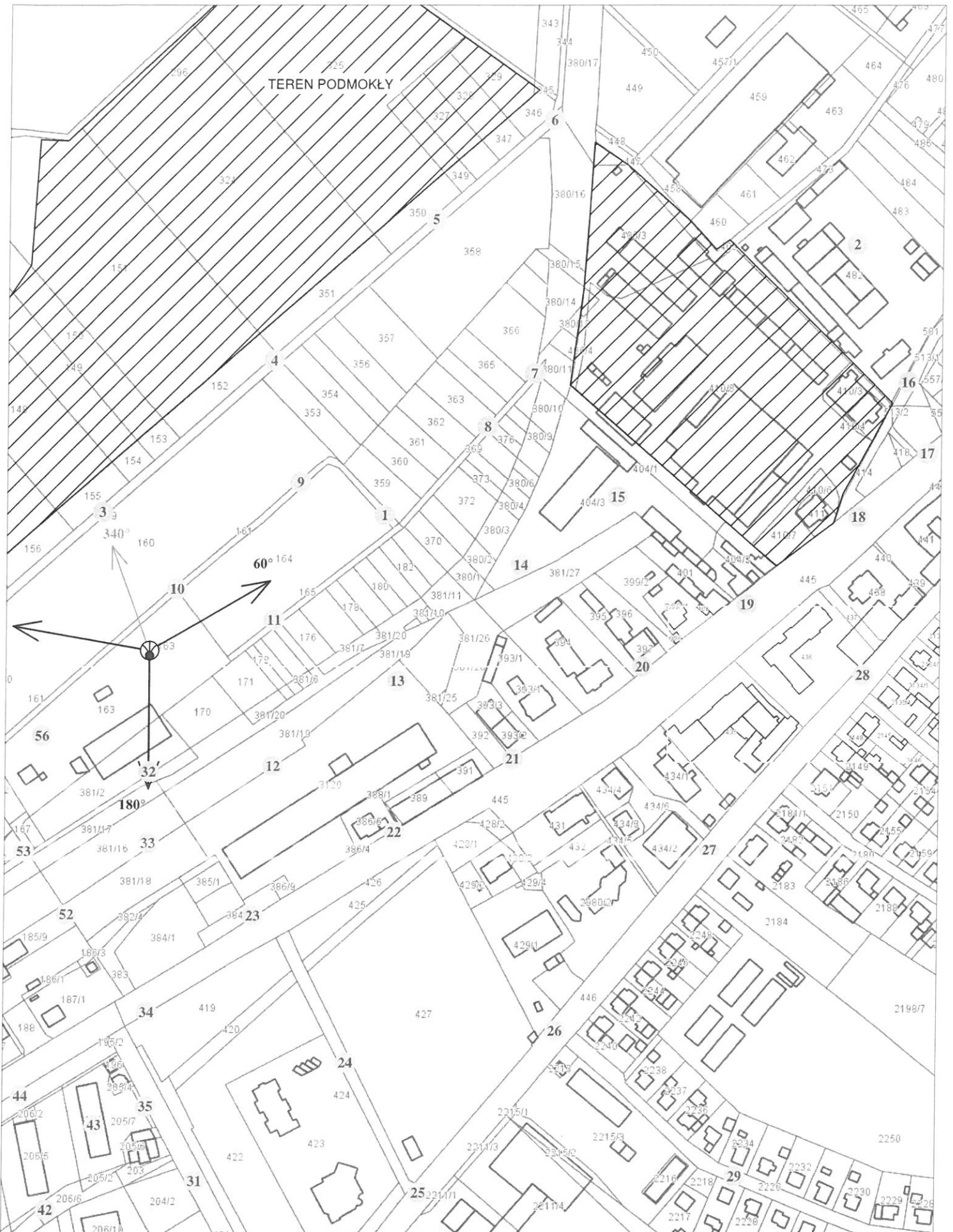
Rys. 2 Lokalizacja pionów pomiarowych

Legenda: brak dostępu antena radiolinowa źródło PEM pion pomiarowy antena sektorowa