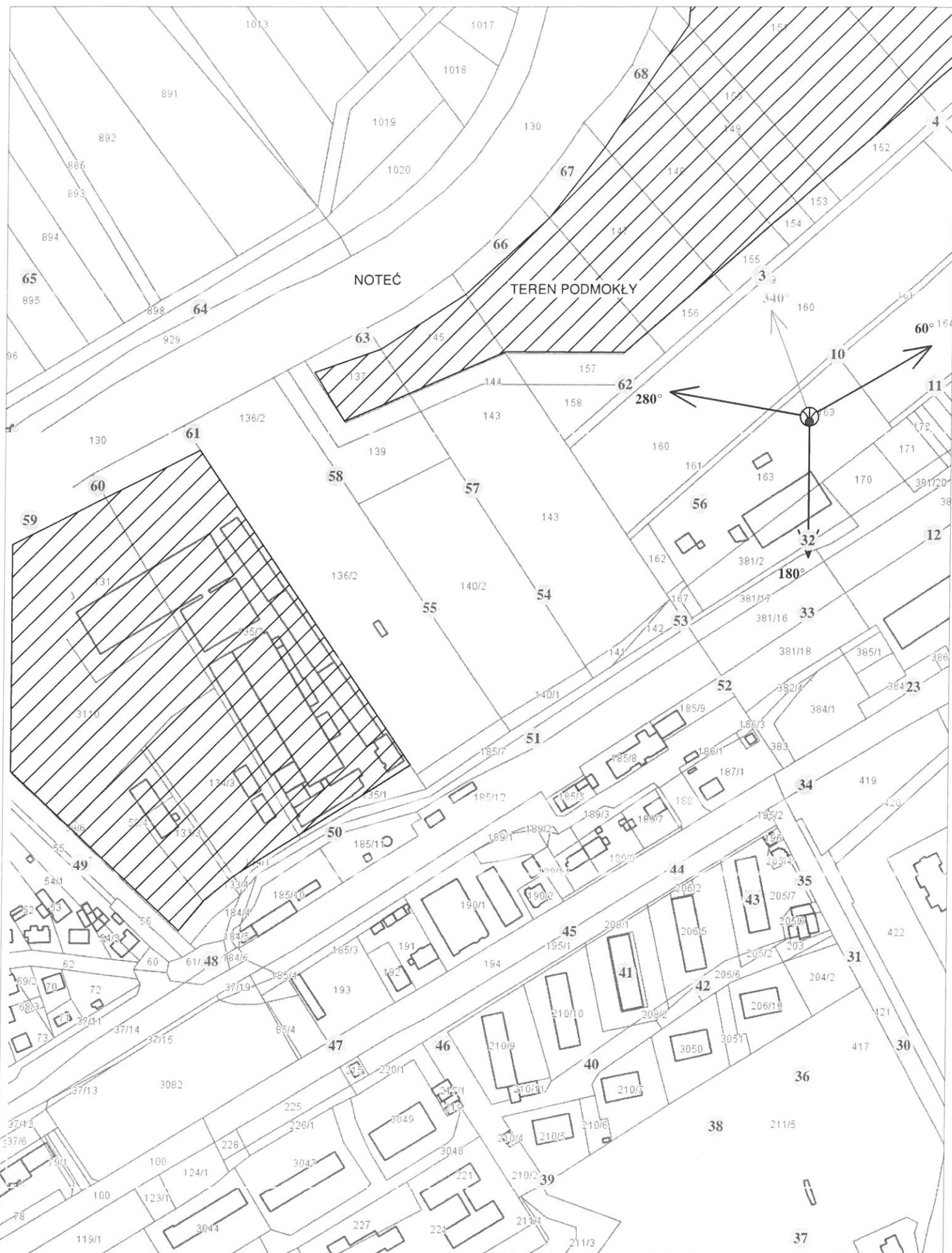
Rys. 3 Lokalizacja pionów pomiarowych

Legenda: brak dostępu antena radiolinowa źródło PEM pion pomiarowy antena sektorowa