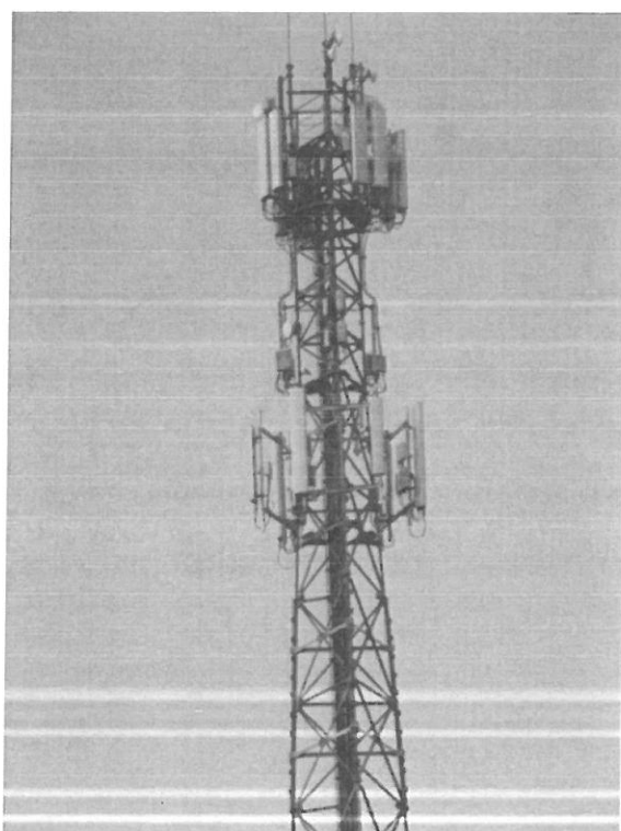
Rys. 4 Widok badanego obiektu