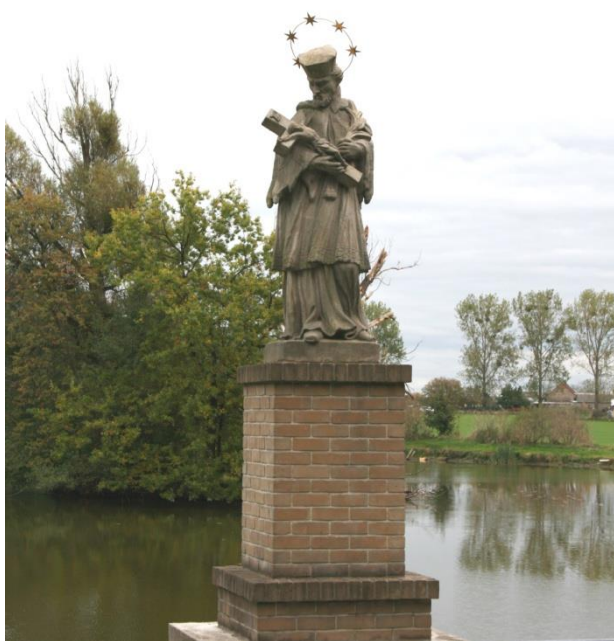
Sławno, gm. Lubasz, figura przydrożna św. Jana Nepomucena

Zagrożone pod względem konserwatorskim są także krzyże i kapliczki przydrożne. Brak pełnej ewidencji tych dóbr kultury może spowodować ich degradację. W związku z tym dla ich ochrony najważniejszym zadaniem będzie sporządzenie inwentaryzacji oraz ocena stanu zachowania tych obiektów. Jedną z najstarszych na terenie powiatu jest figura przydrożna św. Jana Nepomucena w Sławnie, gm. Lubasz. Datowana na koniec XVIII w., wykonana w piaskowcu, jako jedyna została poddana profesjonalnej konserwacji i restauracji.