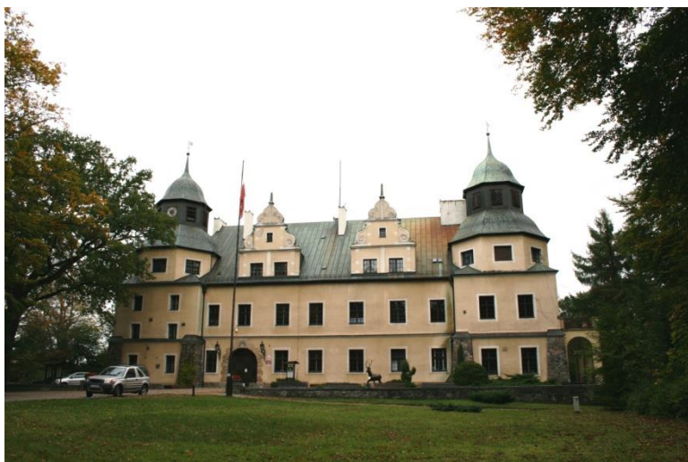
Goraj, gm. Czarnków, pałac