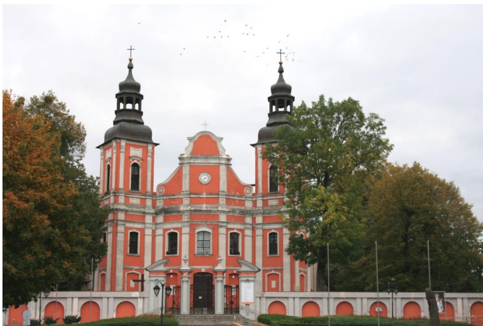
Lubasz, kościół parafialny p.w. Narodzenia NMP – Sanktuarium Królowej Rodzin