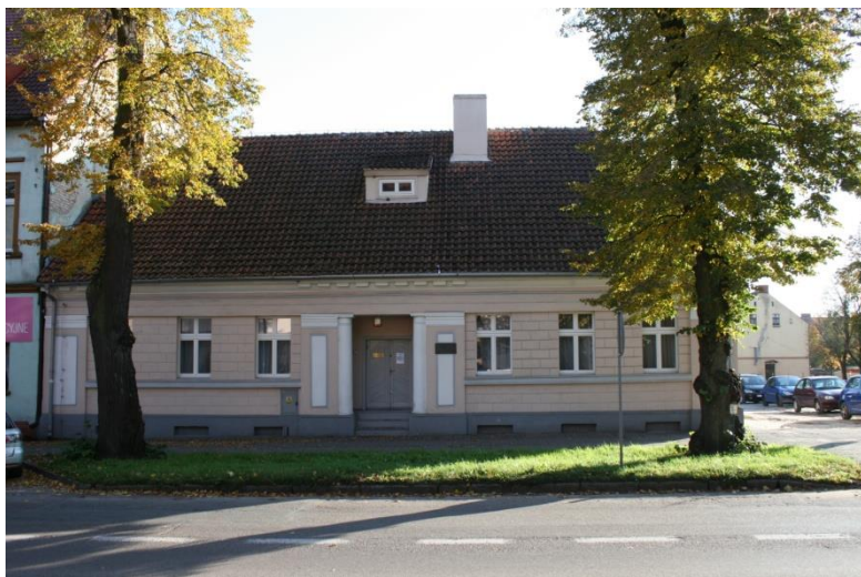
Trzcianka, dom burmistrza przy ul. Żeromskiego 36a, ob. Muzeum Ziemi Nadnoteckiej

domy wykonane w całości lub częściowo z gliny (najwięcej w gminie Drawsko i Połajewo). W miastach obok zabudowy jednokondygnacyjnej występują kamienice ze skromnym detalem architektonicznym w postaci gzymsów i opasek okiennych lub bogatszym – utrzymanym w stylistyce eklektyzmu, historyzmu czy secesji. Wyróżniającą się grupę stanowią budynki z dwudziestolecia międzywojennego, noszące cechy architektury modernistycznej, których najwięcej spotkać można w Wieleniu (w jego części północnej), Trzciance i Krzyżu Wielkopolskim.