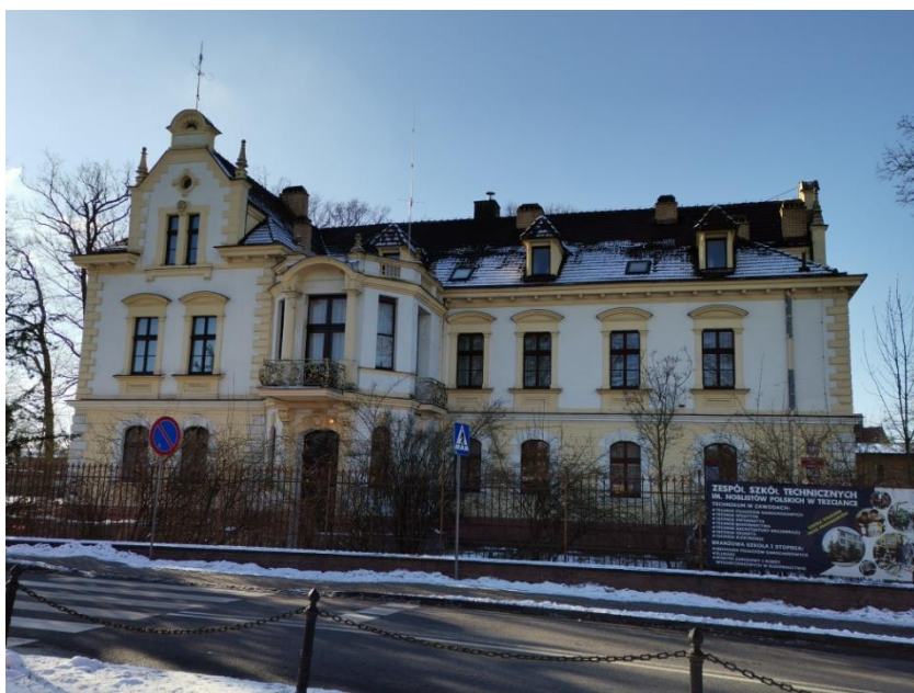
Wieleń, Starostwo Powiatowe, ob. Dom Pomocy Społecznej