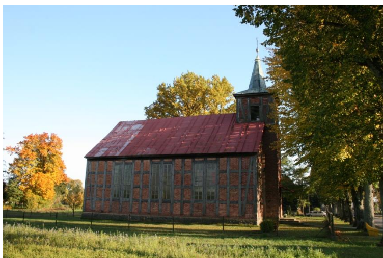
Kocień Wielki, gm. Wieleń, kościół filialny p.w. św. Anny