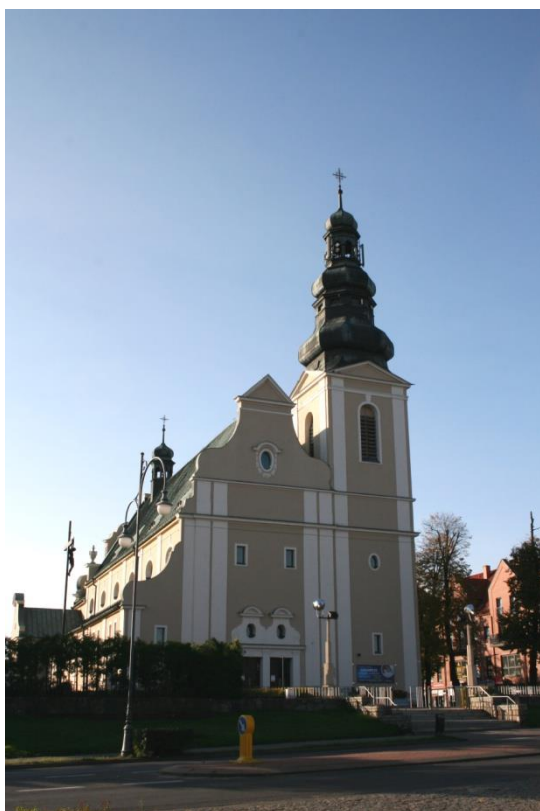
Trzcianka, kościół parafialny p.w. św. Jana Chrzciciela

Wyróżniającą się grupę kościołów stanowią obiekty murowane powstałe w 2 poł. XIX i na początku XX w., reprezentujące historyczne budownictwo sakralne czerpiące wzory z architektury romańskiej i gotyckiej. Najczęściej są to świątynie poewangelickie, np. w Siedlisku (1907 – 1908 r.), Radolinie (1893 r.), Nowej Wsi (1908 r.), Kępie (2 poł. XIX w.), Gębicach (1869 – 1877 r.), Romanowie Dolnym (1852 r.), Folsztynie (1869 - 1870 r.), Dębogórze (ok. 1910 r.), Zielonowie (1915 r.), Kwiejcach (1909 r.), Połajewie (1859 r.). Wyjątkiem jest kościół katolicki w Piłce. Są to najczęściej budynki murowane z cegły ceramicznej, nietynkowane, z centralnie lub bocznie usytuowaną wieżą, otworami okiennymi zamkniętymi ostrołukowo lub półkoliście i neoromańskim lub neogotyckim detalem architektonicznym. Na tle tym wyróżnia się kościół w Siedlisku, którego wieża zwieńczona jest niebywale wysoką, ostrosłupową iglicą oraz kościół w Połajewie – okazała trójnawowa bazylika z pięciobocznie zamkniętym prezbiterium i częściowo zachowaną drewnianą stolarką okienną i drzwiową z maswerkową dekoracją.