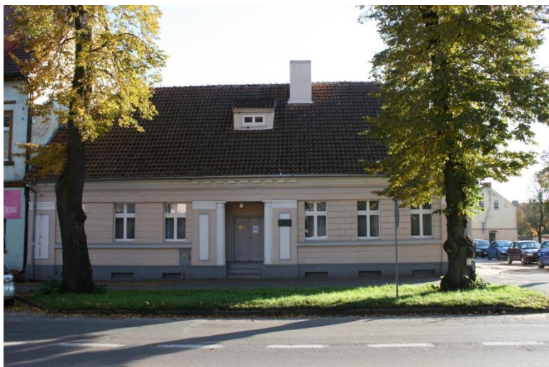
Trzcianka, dom burmistrza przy ul. Żeromskiego 36a, ob. Muzeum Ziemi Nadnoteckiej

domy wykonane w całości lub częściowo z gliny (najwięcej w gminie Drawsko i Połajewo). W miastach obok zabudowy jednokondygnacyjnej występują kamienice ze skromnym detalem architektonicznym w postaci gzymsów i opasek okiennych lub bogatszym – utrzymanym w stylistyce eklektyzmu, historyzmu czy secesji. Wyróżniającą się grupę stanowią budynki z dwudziestolecia międzywojennego, noszące cechy architektury modernistycznej, których najwięcej spotkać można w Wieleniu (w jego części północnej), Trzciance i Krzyżu Wielkopolskim.