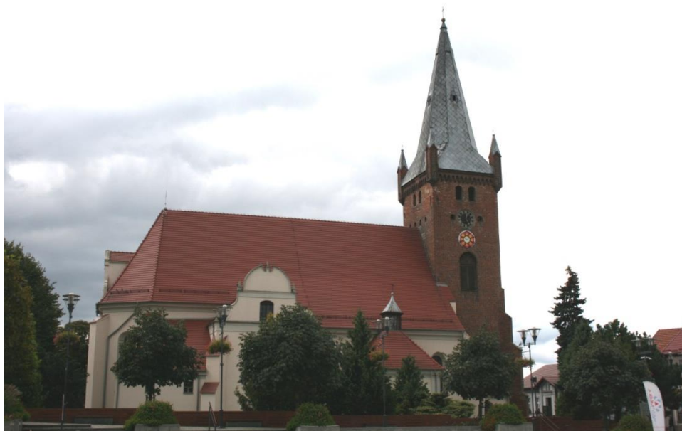
Czarnków, kościół parafialny p.w. św. Marii Magdaleny

Kościół parafialny p.w. Narodzenia NMP w Lubaszu został zbudowany w l. 1750 – 1761 jako odpustowy z fundacji Wojciecha Maksymiliana Miaskowskiego herbu Bończa, wojewody kaliskiego, na tzw. Krasnej Górze, w miejscu poprzednich świątyń. Okazała murowana budowla z szeroką nawą, zamkniętym półkoliście prezbiterium, dwiema analogicznymi kaplicami na planie podkowy oraz wypukłą fasadą ujętą ukośnie ustawionymi wieżami, została wzniesiona w stylu późnobarokowym. Obecnie pełni funkcję sanktuarium.