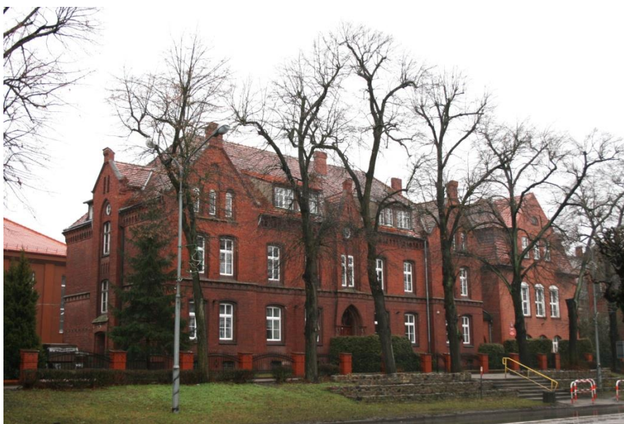
Czarnków, Królewskie Seminarium Nauczycielskie, ob. Liceum Ogólnokształcące

Ww. obiekty pełnią swoją pierwotną funkcję. Ich stan jest dobry, historyczny wygląd zachowany, a wszelkie działania związane z adaptacją czy remontami prowadzone są z poszanowaniem ich zabytkowych wartości.