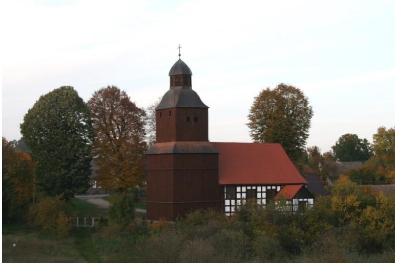
Dzierżążno Wielkie, gm. Wieleń, kościół parafialny p.w. MB Różańcowej