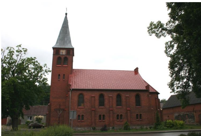
Radolin, gm. Trzcianka, kościół filialny p.w. MB Nieustającej Pomocy