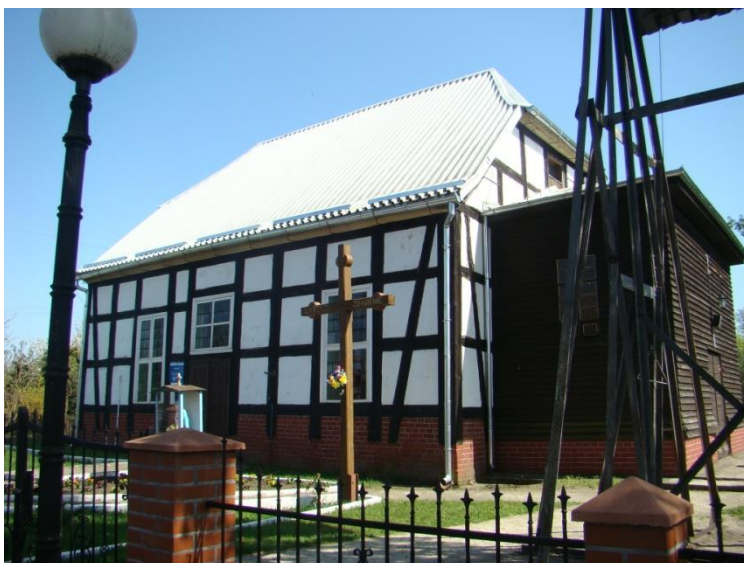
Chetst, gm. Drawsko, kościół filialny p.w. MB Królowej Polski