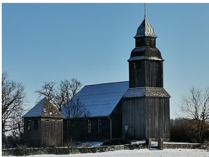
Nowe Dwory, gm. Wieleń, kościół filialny p.w. Narodzenia św. Jana Chrzciciela