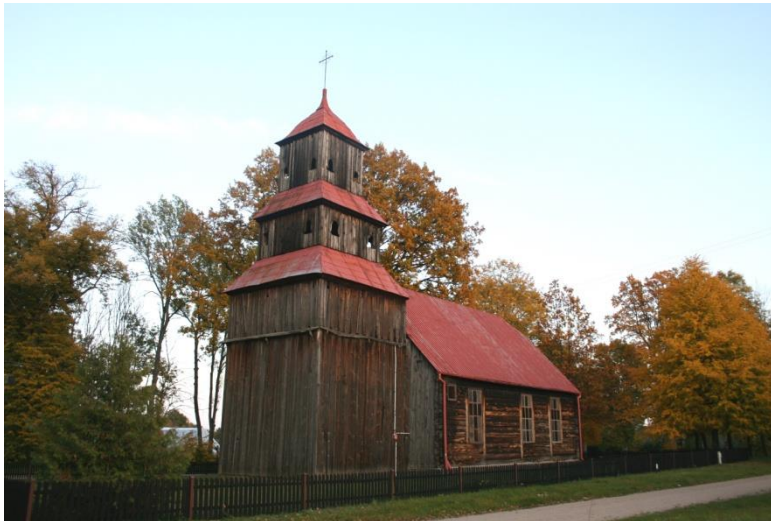
Dzierżążno Małe, gm. Wieleń, kościół filialny p.w. NSPJ