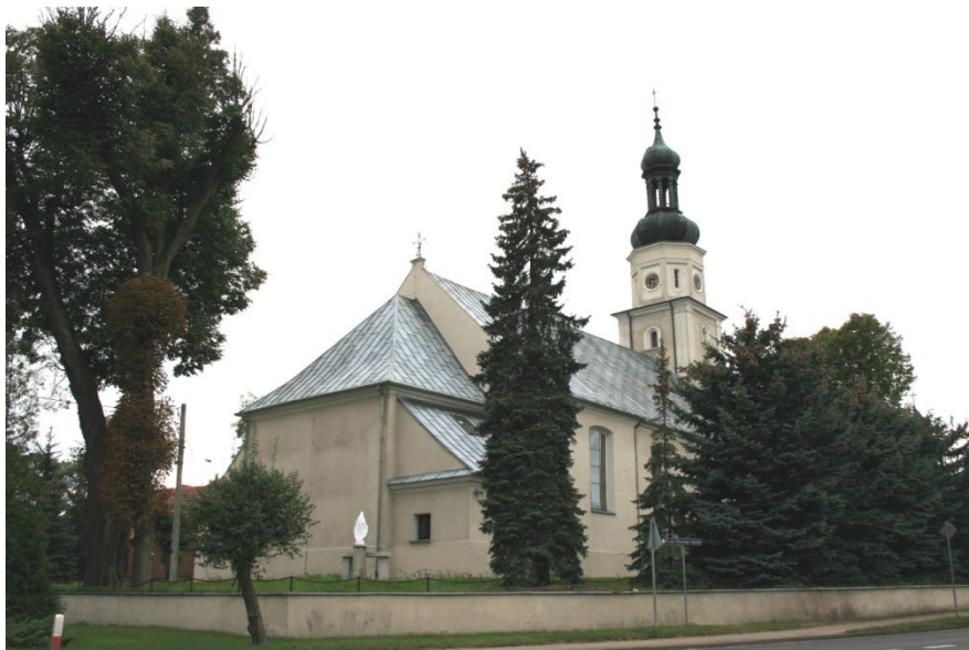
Połajewo, kościół parafialny p.w. św. Michała Archanioła

znajdują się dwie kaplice wybudowane na początku XX w., założone na planie ośmioboku, jedna bez wyraźnych cech stylowych, druga neobarokowa o elewacjach ozdobionych boniowanymi lizenami i wejściem ujętym dwiema parami pilastrów wspierających trójkątny fronton, nakryta dachem kopulastym z latarnią.