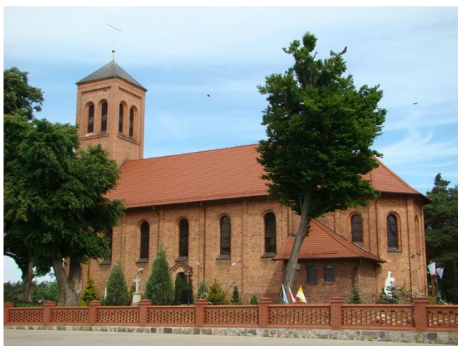
Piłka, gm. Drawsko, kościół parafialny p.w. NMP Wniebowziętej

Jedną z charakterystycznych cech krajobrazu kulturowego powiatu czarnkowsko – trzcianeckiego jest duża ilość pałaców i dworów. W ewidencji znajduje się 35 obiektów, z czego 13 wpisanych jest do rejestru zabytków.