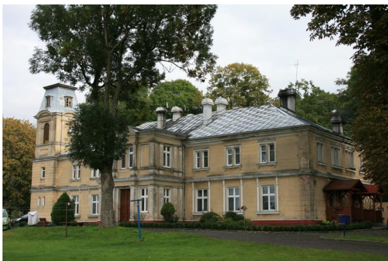
Bzowo, gm. Lubasz, pałac