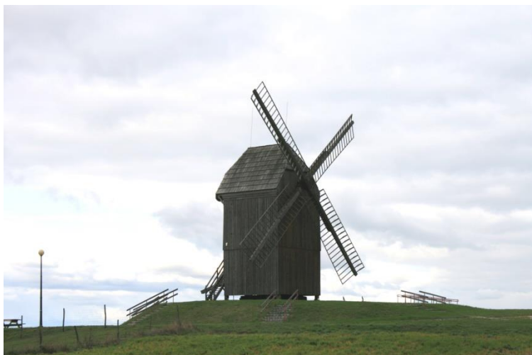
Dębe, gm. Lubasz, wiatrak koźlak

Na terenie powiatu znajduje się 46 zespołów folwarcznych i dworsko – folwarcznych, ujętych w ewidencji zabytków, najwięcej w gminie Trzcianka i Czarnków. Na uwagę zasługują również obiekty architektury gospodarczej i przemysłowej: wiatrak koźlak w Dębem (XVIII/XIX w.), spichlerze, m. in. W Ciszowie (k. XVIII w., ryglowy) i Czarnkowie przy ul. Sikorskiego 9 (poł. XIX w., murowano – ryglowy), gorzelnie, m. in. w Hucie (4 ćw. XIX w.), Połajewie (2 poł. XIX w.), Białej, gm. Trzcianka (1809 r., przebudowana w 1894 r.), młyny, m. in. w Kuźnicy Czarnkowskiej (poł. XIX w.), Jędrzejewie, gm. Lubasz (4 ćw. XIX w.), Jędrzejewie, gm. Czarnków (I. 30-te XX w.), Kamienniku (pocz. XX w.), Gulczu (I. 1874 – 1923), Hucie Szklanej (1893 r.), Mężyku (ok. 1901 r.), browar w Czarnkowie (1893 r.), zespół gazowni miejskiej w Czarnkowie (1902 r.) oraz zespoły dworców i stacji kolejowych, m. in. w Krzyżu Wielkopolskim (1851 r., 2 poł. XIX w.), Drawskim Młynie (XIX/XX w.), Wieleniu Północnym (1851 r., 2 poł. XIX w.), Wieleniu Południowym (1896 r.), Trzciance (1852 r., pocz. XX., ok. 1920 r.), Biernatowie (ok. 1900 r.), Siedlisku (ok. 1900 r.), Stobnie (pocz. XX w.), Czarnkowie (1896 r., 1911 r.), Goraju (1913 r.).