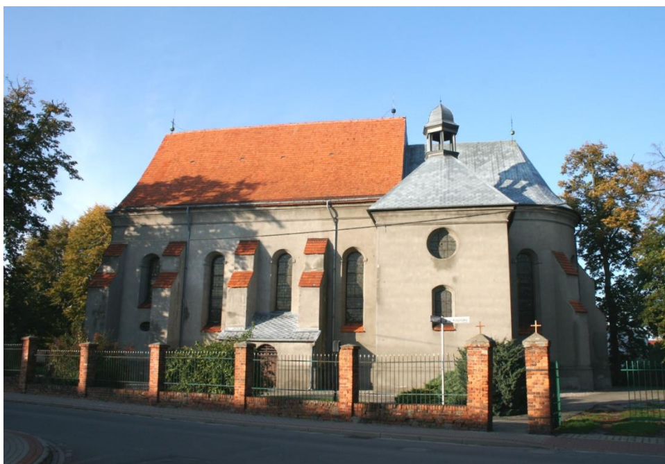
Wieleń, kościół parafialny p.w. Wniebowzięcia MB i św. Michała

świątyni ujmują przypory. Fasada z wejściem na osi zwieńczona jest trójkątnym szczytem wydzielonym szerokim gzymsem. Elewacje charakteryzują się surową formą pozbawioną dekoracji.