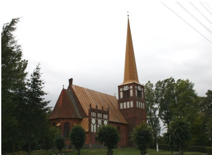
Siedlisko, gm. Trzcianka, kościół parafialny p.w. NSPJ