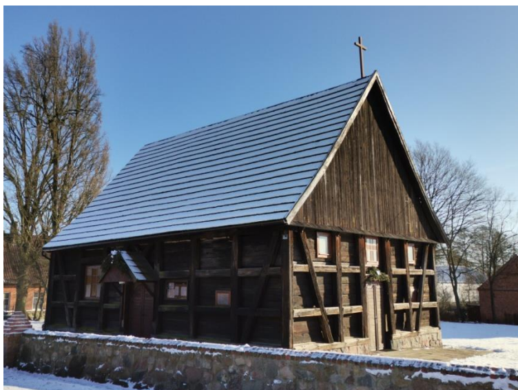
Herburtowo, gm. Wieleń, kościół filialny p.w. MB Siewnej