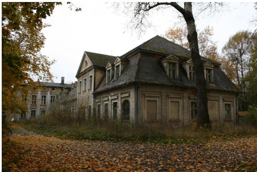
Biała, gm. Trzcianka, pałac (dawna oficyna zamkowa)

Oficyna z 1929 r. jest budynkiem o formach modernistycznych, murowanym, wzniesionym na rzucie prostokąta z zamkniętym wielobocznym ryzalitem po boku tylnej elewacji, centralnie umieszczonym w fasadzie wejściem głównym osadzonym w profilowanej wnęcie oraz dachem czterospadowym z prostokątnymi lukarnami. Obiekt użytkowany przez Młodzieżowy Ośrodek Socjoterapii znajduje się w dobrym stanie technicznym.