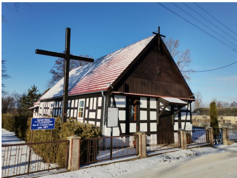
Huta Szklana, gm. Krzyż Wlkp., kościół filialny p.w. MB Częstochowskiej