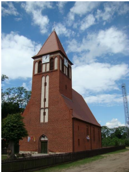
Kwiejce, gm. Drawsko, kościół filialny p.w. Niepokalanego Serca Maryi z Fatimy