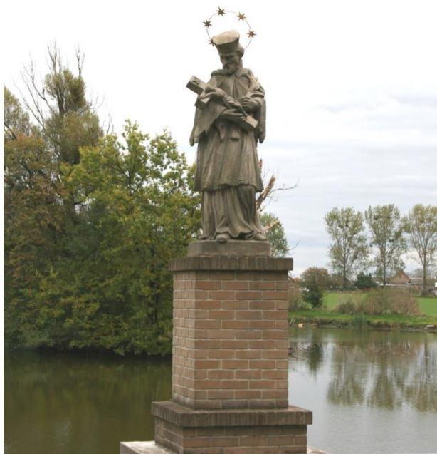
Sławno, gm. Lubasz, figura przydrożna św. Jana Nepomucena

rzeźba św. Jana Nepomucena w Sławnie, gm. Lubasz. Datowana na koniec XVIII w., wykonana w piaskowcu, jako jedyna została poddana profesjonalnej konserwacji i restauracji.