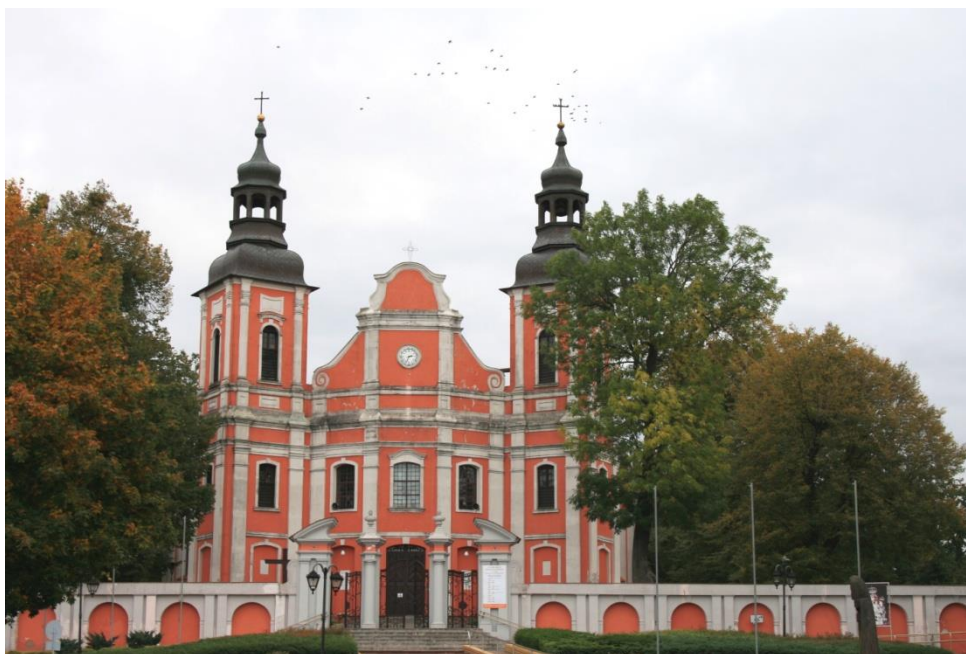
Lubasz, kościół parafialny p.w. Narodzenia NMP – Sanktuarium Królowej Rodzin

Kościół parafialny p.w. Narodzenia NMP w Lubaszu został zbudowany w l. 1750 – 1761 jako odpustowy z fundacji Wojciecha Maksymiliana Miaskowskiego herbu Bończa, wojewody kaliskiego, na tzw. Krasnej Górze, w miejscu poprzednich świątyń. Okazała murowana budowla z szeroką nawą, zamkniętym półkoliście prezbiterium, dwiema analogicznymi kaplicami na planie podkowy oraz wypukłą fasadą ujętą ukośnie ustawionymi wieżami, została wzniesiona w stylu późnobarokowym. Obecnie pełni funkcję sanktuarium.