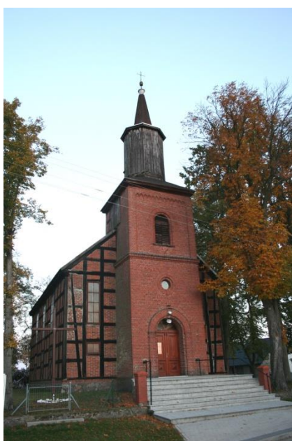
Biernatowo, gm. Trzcianka, kościół filialny p.w. Wniebowzięcia NMP

Na uwagę zasługują również inne kościoły z terenu powiatu, wyróżniające się wartościami historycznymi i architektonicznymi: kaplica p.w. św. Zofii w Gębicach, kościół parafialny w Połajewie, Białej, gm. Trzcianka, Rosku oraz Trzciance.