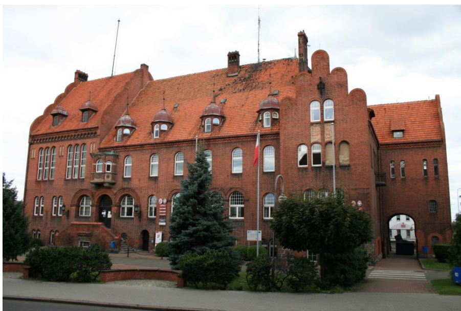
Czarnków, Starostwo Powiatowe

Budynek zlokalizowany jest na obszarze historycznego układu urbanistycznego miasta Czarnkowa wpisanego do rejestru zabytków pod numerem A – 719 decyzją z dnia 13.12.1990 r., w związku z powyższym prace przy nim wymagają uzyskania pozwolenia Wielkopolskiego Wojewódzkiego Konserwatora Zabytków.