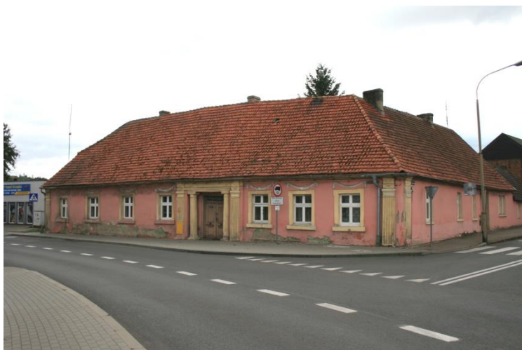
Czarnków, dworek przy ul. Rybaki 28

Na ok. 1800 r. datowany jest dworek położony przy ul. Rybaki 28 w Czarnkowie (tzw. dworek Swinarskich). W XIX w. dostawiono do niego boczne skrzydło. Zbudowany w stylu neoklasycystycznym, parterowy, nakryty dachem naczółkowym i dwuspadowym, z wnęką podcieniową w fasadzie ujętą parą kolumn i pilastrów oraz dekoracją sztukatorską nad oknami w formie podwieszonych festonów.