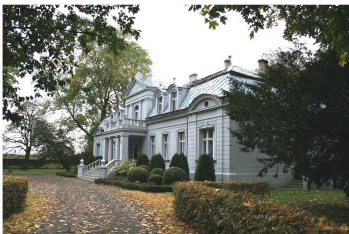
Sławno, gm. Lubasz, pałac

Na terenie powiatu znajduje się 46 zespołów folwarcznych i dworsko – folwarcznych, ujętych w ewidencji zabytków, najwięcej w gminie Trzcianka i Czarnków. Na uwagę zasługują również obiekty architektury gospodarczej i przemysłowej: wiatrak koźlak w Dębem (XVIII/XIX w.), spichlerze, m. in. W Ciszowie (k. XVIII w., ryglowy) i Czarnkowie przy ul. Sikorskiego 9 (poł. XIX w., murowano – ryglowy), gorzelnie, m. in. w Hucie (4 ćw. XIX w.), Połajewie (2 poł. XIX w.), Białej, gm. Trzcianka (1809 r., przebudowana w 1894 r.), młyny, m. in. w Kuźnicy Czarnkowskiej (poł. XIX w.), Jędrzejewie, gm. Lubasz (4 ćw. XIX w.), Jędrzejewie, gm. Czarnków (I. 30-te XX w.), Kamienniku (pocz. XX w.), Gulczu (I. 1874 – 1923), Hucie Szklanej (1893 r.), Mężyku (ok. 1901 r.), browar w Czarnkowie (1893 r.), zespół gazowni miejskiej w Czarnkowie (1902 r.) oraz zespoły dworców i stacji kolejowych, m. in. w Krzyżu Wielkopolskim (1851 r., 2 poł. XIX w.), Drawskim Młynie (XIX/XX w.), Wieleniu Północnym (1851 r., 2 poł. XIX w.), Wieleniu Południowym (1896 r.), Trzciance (1852 r., pocz. XX., ok. 1920 r.), Biernatowie (ok. 1900 r.), Siedlisku (ok. 1900 r.), Stobnie (pocz. XX w.), Czarnkowie (1896 r., 1911 r.), Goraju (1913 r.).