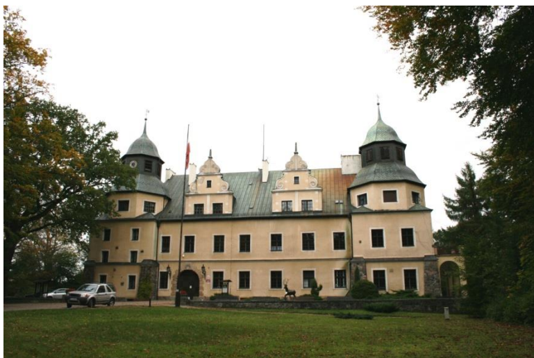
Goraj, gm. Czarnków, pałac