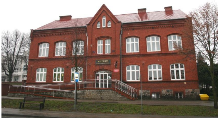
Czarnków, szkoła katolicka, ob. Muzeum Ziemi Czarnkowskiej i Miejska Biblioteka Publiczna

Najstarsze obiekty mieszkalne na terenie powiatu czarnkowsko – trzcianeckiego, pochodzące z XVIII w. oraz 1 poł. XIX w., zachowane są bardzo nielicznie. To najczęściej domy drewniane (konstrukcji zrębowej i ryglowej), murowane lub drewniano – murowane, zarówno wąskofrontowe jak i szerokofrontowe. Wymienić tu należy dom w zagrodzie olęderskiej w Gębiczynie, gm. Czarnków, wybudowany w 1747 r. (z cegły glinianej, otynkowany) oraz dom burmistrza przy ul. Żeromskiego 36a w Trzciance, ob. siedziba Muzeum Ziemi Nadnoteckiej, datowany na 1 połowę XIX w. (murowany, nakryty dachem naczółkowym, o neoklasycystycznym detalu architektonicznym w postaci boniowania na elewacjach i wnęki podcieniowej ujętej kolumnami), ponadto domy drewniane lub drewniano – murowane: m. in. w Żelichowie, Marylinie, Kamienniku, Pęcckowie, Folsztynie, Nowych Dworach i Miałach. Pozostała zabytkowa zabudowa mieszkalna powstała w większości na przestrzeni 2 poł. XIX w. i 1 poł. XX w. Reprezentują ją najczęściej murowane, jednokondygnacyjne domy kalenicowe (zarówno tynkowane jak i o elewacjach z cegły ceramicznej), nakryte dachami dwuspadowymi lub rzadziej naczółkowymi, z otworami okiennymi i drzwiowymi prostokątnymi lub zamkniętym łukiem odcinkowym, czasem posiadające facjaty. Ceglane elewacje domów zdobią niekiedy wąskie gzymsy nadokienne, fryzy ząbkowe oraz gzymsy wieńczące. Pojawiają się również