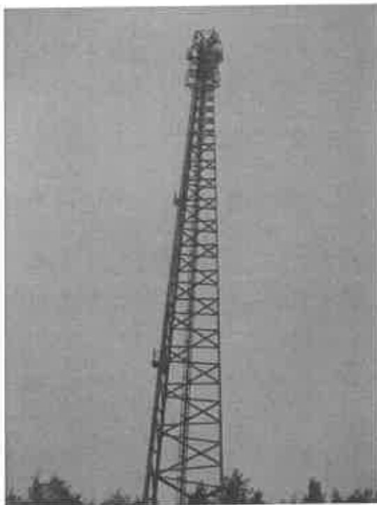
Załącznik nr 1: Widok ogólny instalacji radiokomunikacyjnej.

Koniec sprawozdania. Sprawozdanie zawiera dodatkowo załączniki nr 1 i 2.