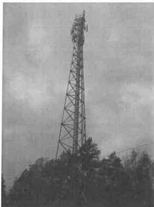
Zof. nr 1: Widok ogólny instalacji radiokomunikacyjnej.